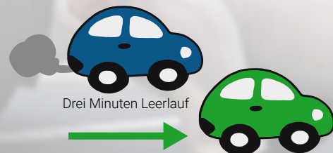
Grafik: VKM Ein Kilometer Fahrt mit 50 km/h

Elektrische Verbraucher wie Sitzheizung oder Heckscheibenheizung bedeuten höheren Verbrauch und sollten daher ebenfalls abgeschaltet werden, wenn sie nicht mehr benötigt werden. Weil sich beim Warmlaufen im Stand der Motor nur extrem langsam erwärmt, sollte man ihn warmfahren statt warmlaufen lassen.