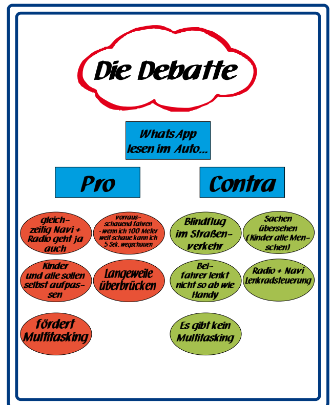
Beispielerggebnisse (Berufsbildende Schulen und Gymnasien Lingen, 20./21.04.26)